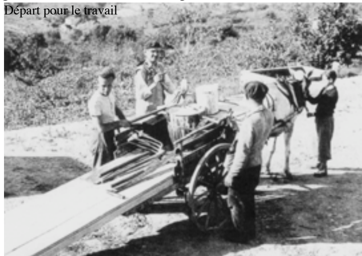
Départ pour le travail

et les médicaments, aussi les vêtements, la literie et les fournitures scolaires. Nous avons eu l'aide matérielle de « L'Unitarian Service » de Marseille. Les hôpitaux de Nice nous ont proposé des soins gratuits. L'action évangélique de Cannes nous a aussi aidés. Pour les visites de contrôle sur place, le maire est intervenu pour que le docteur Maurel vienne à titre gracieux.