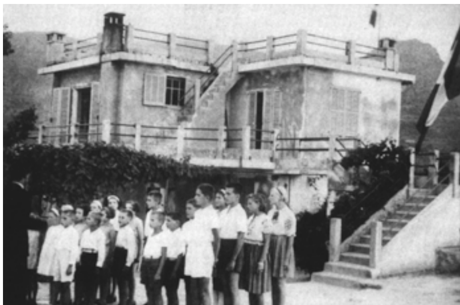
les enfants devant le bâtiment de l'école

Durant l'année 1942 la situation politique empirait dans notre région. Nous avons reçu des avertissements de zone occupée. Nos employés juifs ne sortaient plus. Concernant leur devenir, la réponse des services de Police n'était pas claire. Pour les enfants la Préfecture nous rassurait étant donné que le gouvernement avait autorisé l'accueil des petits orphelins dans les Alpes Maritimes.