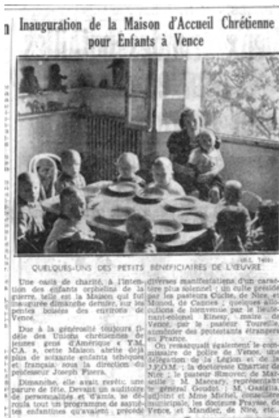
L'Éclaireur de Nice et du Sud-Est – 22 juillet 1941