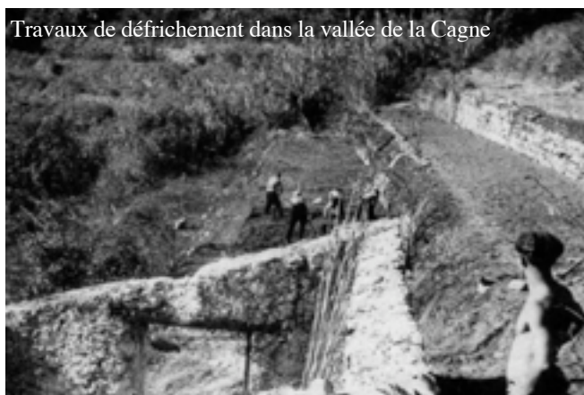
Travaux de défrichage dans la vallée de la Cagne

Nous avons fait le maximum pour que les enfants se sentent ici comme dans une grande famille. Nombre d'entre eux d'ailleurs n'en avait plus. Ceux qui avaient séjourné dans les camps avaient des maladies chroniques, souffraient de maux dus à la malnutrition, à l'absence d'hygiène : problèmes digestifs, maladies de peau et autres. Six mois après l'inauguration du Centre on hébergeait 80 enfants et adolescents et 10 nourrissons.